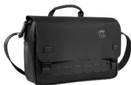
TT Support Bag