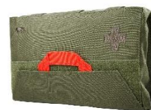
TT IFAK Pouch Olive