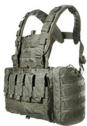
TT Chest RIG MKII M4

Unter allen Teilnehmern* werden folgende Sachpreise verlost: